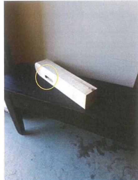
Hacer la caja con la escopleadora