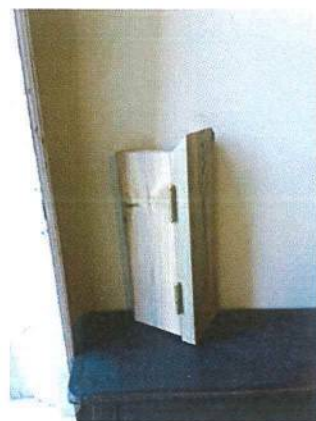
Montaje de dos pernios en canto