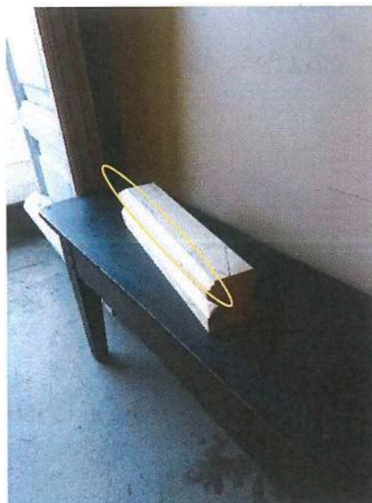
Con la Tupí realizar una moldura