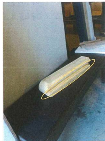
Con la sierra circular un "pico de gorrión"