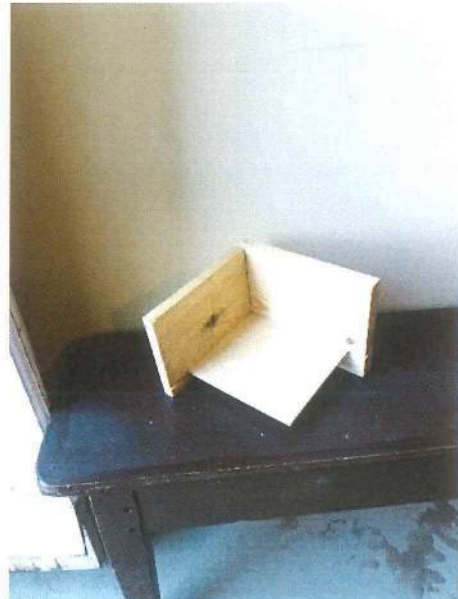
Muestra: unión con lazos y fondillo