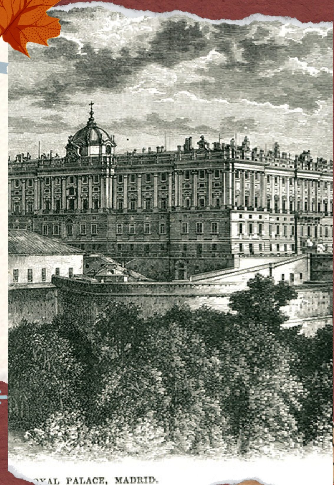
ROYAL PALACE, MADRID.